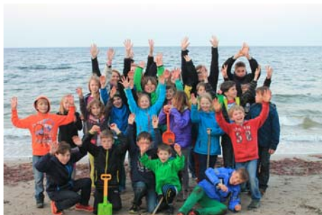
Teilnehmer an der Jugendfahrt nach Kiel

Vor den Sommerferien wurden auf der Trainersitzung der Fußballer die leider ausscheidende Mannschaft der D-Jugend und ein zweites Mal die E-Jugend für den Titelgewinn geehrt.