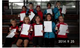
Wettkampf der Jüngsten